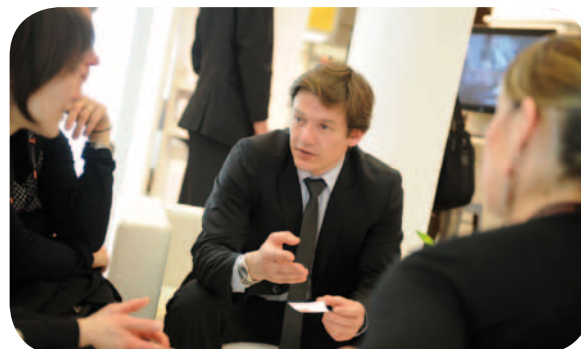
Nos commerciaux ont pu présenter les trois expertises sur le stand lors du CFIA.

Cette multiexpertise nous permet d'offrir les produits et solutions les plus adaptés aux marchés, pour des gammes de produits étendues. Cette valeur ajoutée permet à SCA Packaging France d'accompagner ses clients dans des secteurs aussi variés que l'alimentation, le luxe et l'industrie.